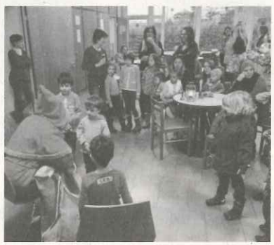
Der Samichlaus hört aufmerksam zu.

Aufregende Spannung herrschte am vergangenen Freitagnachmittag im MüZe. Während die einen Kinder ihre Lebkuchen liebevoll mit Zuckerguss, Zuckerkügelchen und Streuseli verzierten, versuchte der Samichlaus in der Cafeteria den anderen Kindern ein Värslli zu entlocken. Belohnt wurden alle mit einem Chlouse-Säckli.