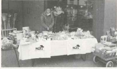
Backwarenstand mit allerlei Gluschtigem.

Am vergangenen Samstag verkauften MüZe-Mitarbeiterinnen vor der Migros beim Zentrum Moos viel Selbstgemachtes. Wer konnte bei diesen gluschtigen Guetzli, Backwaren, Konfitüren, Eingemachtem und Spielsachen einfach vorbeigehen?